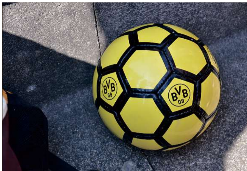
Resch nov ed aposta cumprà per laschar scriver si autograms.