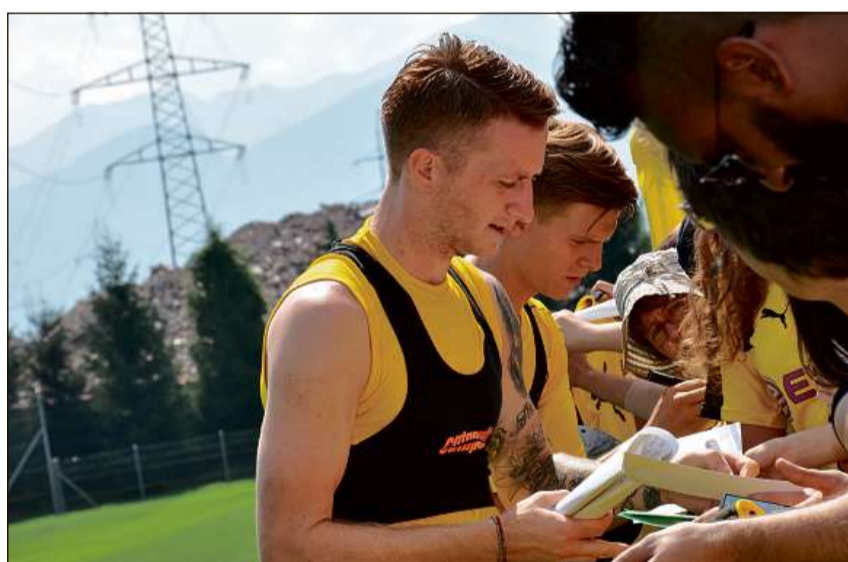
Marco Reus e Julian Weigl fan il pussaivel per cuntentar ils fans. Tuttina turnan il davos mo paucs cun in autogram a chasa.